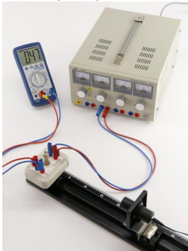
Fig. 2 Experimentieraufbau zum Nachweis des Fotoelektrischen Effekts